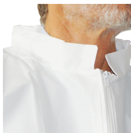
Col mandarin doublé