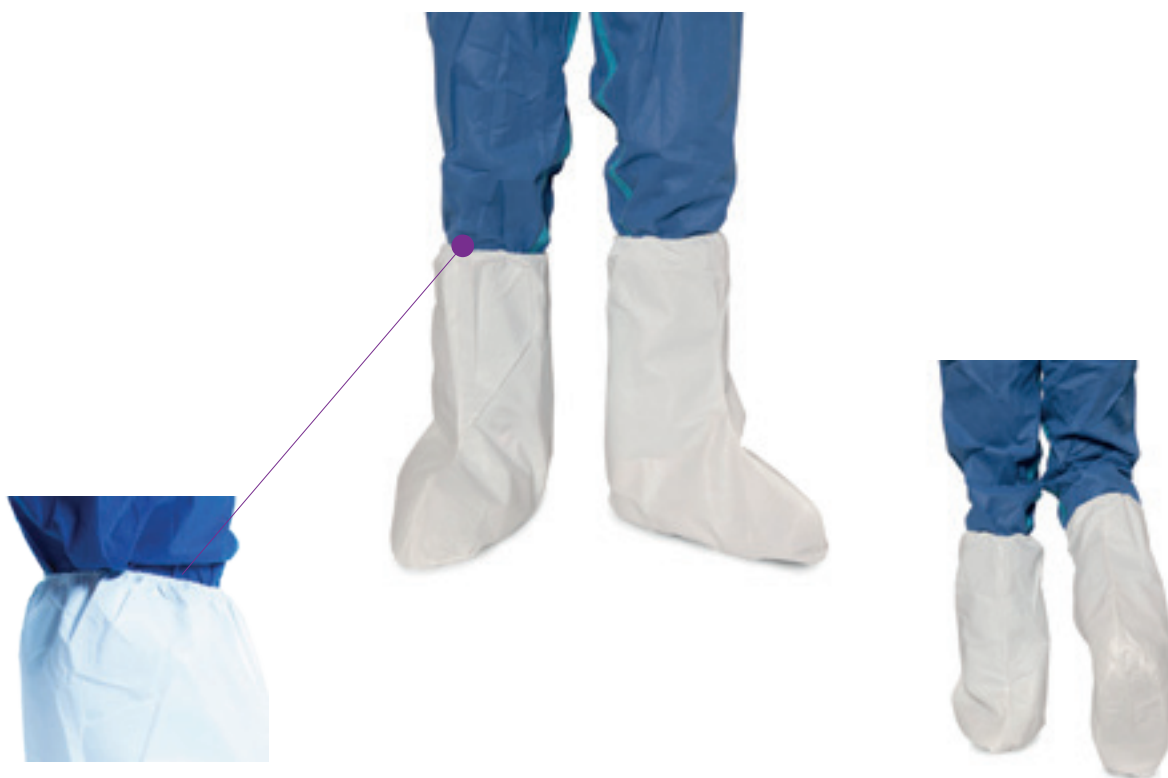
Élastique de serrage au niveau du genou