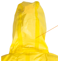
Capuche 3 pièces pour une liberté de mouvement