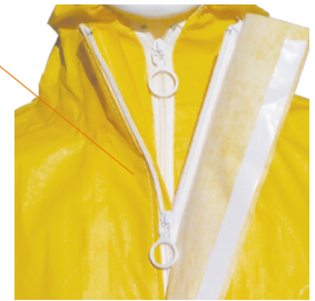
Fermeture à glissière avec anneau