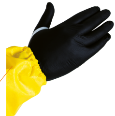
Passe-pouce élastiqué pour éviter aux manches de remonter